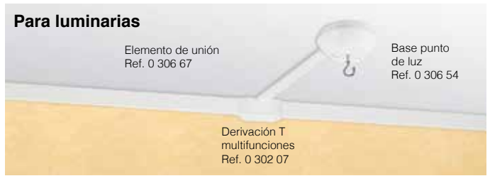
Derivación en ángulo para punto de luz ref. 0 302 07